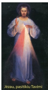
Jėzau, pasitikiu Tavimi

Gailestingumo šventei rengiamasi novena, kuri pradedama Didįjį Penktadienį. Devynias dienas, vienijantis su Kristaus auka ant kryžiaus už mūsų ir viso pasaulio išganymą kalbamas Dievo Gailestingumo vainikėlis. Šią maldą ses. Faustina Jėzus padiktavo Vilniuje 1935 m. rugsėjo 13-14 d.