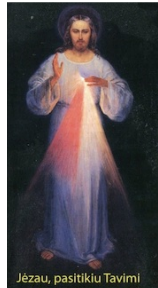
Jėzau, pasitikiu Tavimi

DIEVO GAILESTINGUMO ŠVENTĖ FEAST OF DIVINE MERCY