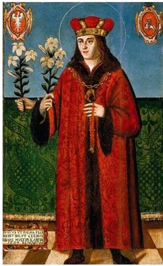
Saint Casimir Jagiellon (Polish: Kazimierz, Lithuanian: Kazimieras; October 3, 1458 – March 4, 1484) was a prince of the Kingdom of Poland and of the Grand Duchy of Lithuania.

VIEŠPATIE, TU TURI AMŽINOJO GYVENIMO ŽODŽIUS. Mišiolėlis: 142 p.; skaitiniai 656 p.; visuotinė malda 1097 p. Ps 18