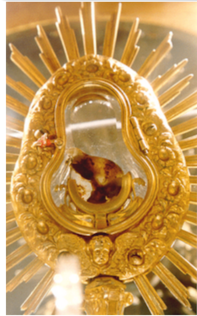
KRISTAUS KŪNAS IR KRAUJAS