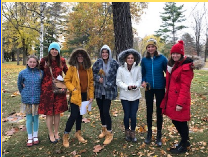
AČIŲ SKAUTĒMS NUO VISOS PARAPIJOS!

PARAPIJĒČIAI, PALAIDOTI HOLY SEPULCHRE KAPINĒSĒ, BUVO APLANKYTI SKAUČIŲ LIETUVAIČIŲ, KURIOS ANT KAPŲ, SEKANT KATALIKIŠKA IR LIETUVIŠKA TRADICIJA, UŽDEGĒ ŽVAKUTES IR PASIMELDĒ.