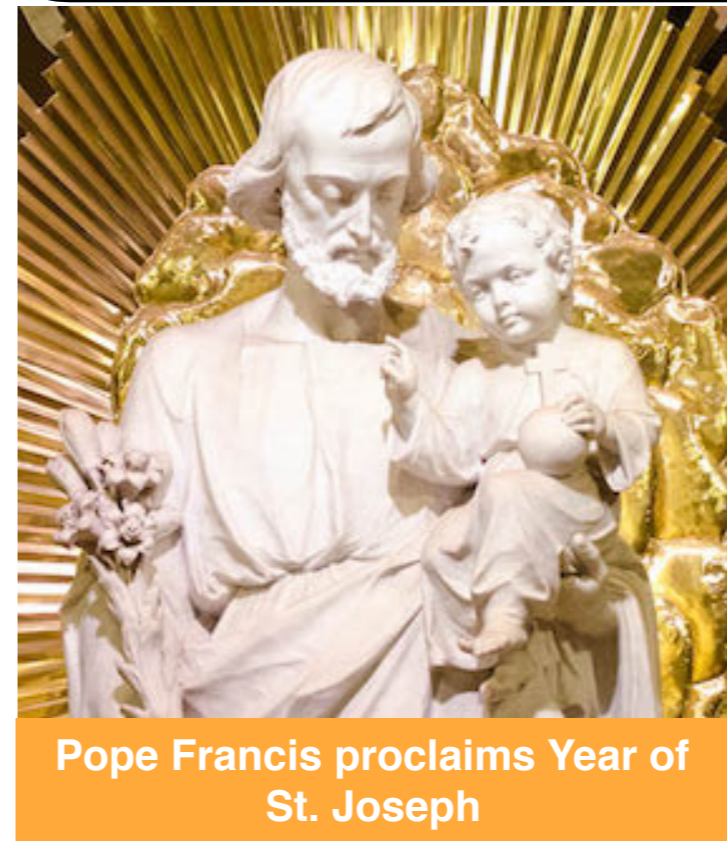
Pope Francis proclaims Year of St. Joseph Vatican City, Dec 8, 2020. Pope Francis announced a Year of St. Joseph in honor of the 150th anniversary of the saint's proclamation as patron of the Universal Church.

VIEŠPATIE, TAVO MALONES GIEGOSIU PER AMŽIUS. Ps 88 Mišiolėlis: 118 p., Skaitiniai 645 p., Visuotinė malda 1091-II p.