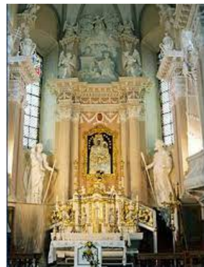
"Lithuania's Greatest Treasure"

Saturday, SEPTEMBER 4, 4:00 p.m. - for Parish